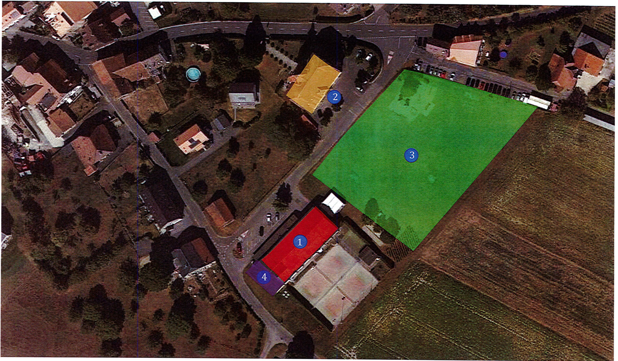
1. Salle polyvalente